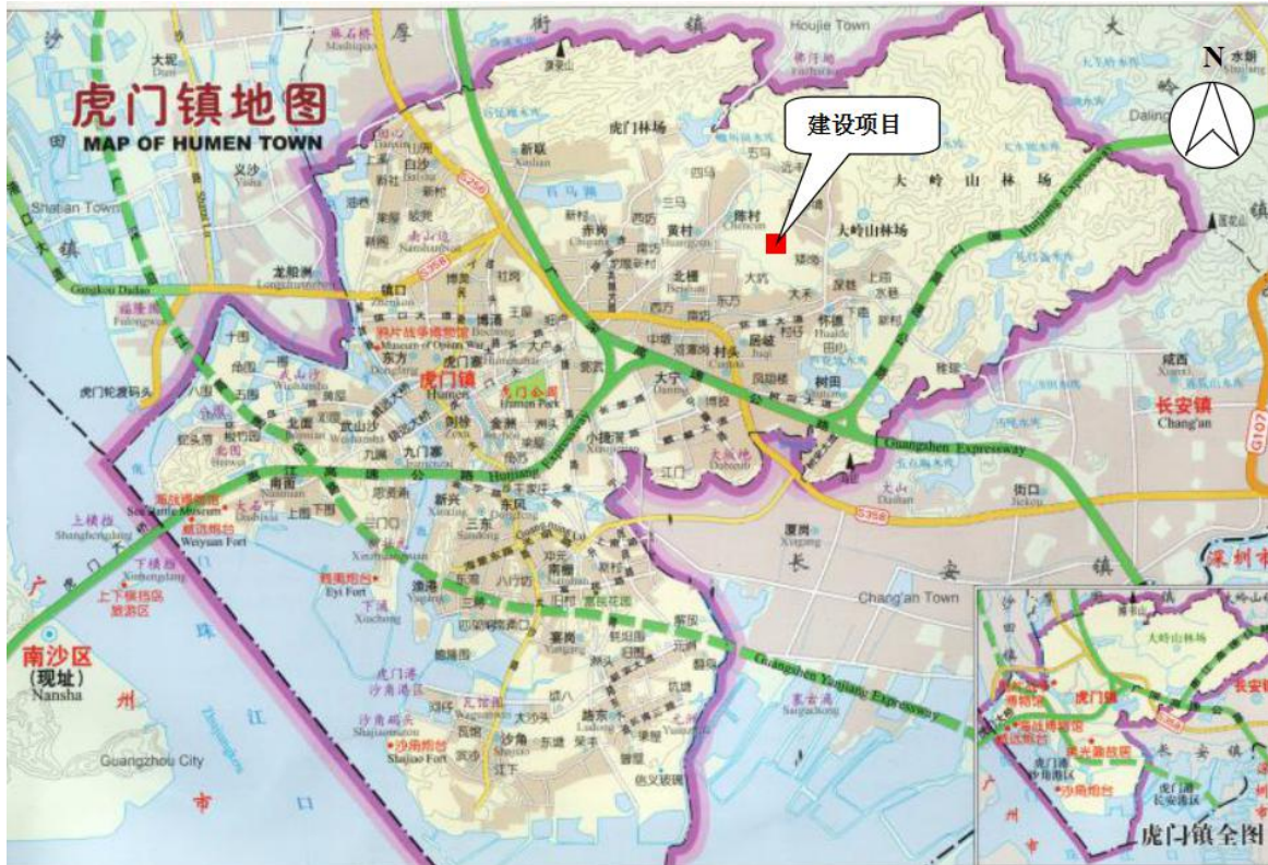
图 3-1 厂区地理位置图

东莞市鑫韵生电子有限公司位于东莞市虎门镇怀德社区矮岗塘仔 9 号 3 楼（地理坐标：N22°50'46.52"，E113°43'46.77"），地理位置见图 3-1，厂区平面布置及监测点位图见图 3-2。