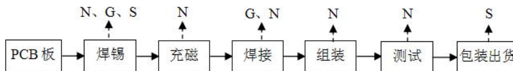
图 3-3 项目生产工艺及产污环节流程图